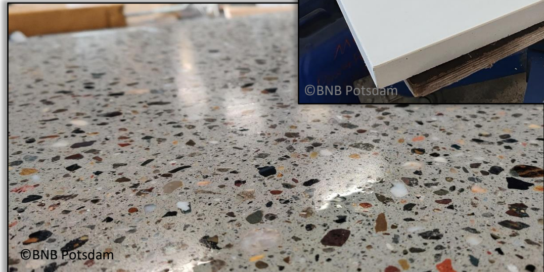
Celitement-basierte Betonwaren, hergestellt von BNB Potsdam